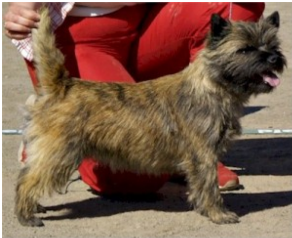
Sama koira 1,5v...

Pikkupennun lopullista väritystä on toisinaan kasvattajankin vaikea ennustaa. Lopullista väriä voi parhaiten arvuutella silmän alla kasvavista karvoista, jonne kasvaa kareaa päälakarvaa yleensä ensimmäisenä. Luovutusiässä monilla pennuilla on runsas tumma pentuturkki. Ensimmäisen trimmauksen jälkeen pennut siis yleensä vaalenevat todellisen värityksen paljastuessa pentukarvan alta. Vuosien mittaan erityisesti brindlet koirat saattavat muuttaa väriään melkoisesti. Ne nimittäin tummuvat trimmaus trimmaukselta ja lopputulos voi olla lähes musta. Alkupeäinen väritys ja kuviointi säilyy kuitenkin pohjavillassa.