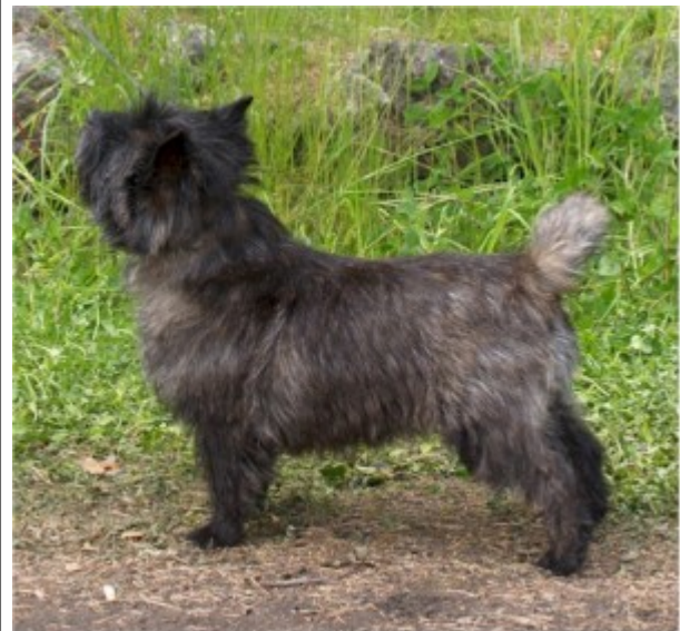
... ja 4 v.

Yksiväriset punaiset tai vehnänväriset koirat säilyttävät värinsä varmemmin, tosin punaisten väri saattaa iän myötä syventyä. Myös vaaleiden cairnien turkkiin saattaa iän myötä ilmestyä tummia karvoja.